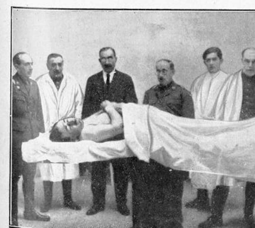
El cadáver del internado Dr. D. Fidel Pagés en el Depósito del Hospital Militar de Burgo, donde fue tratado